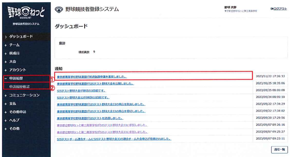
ダッシュボード画面

※加盟団体が差戻しを行うと担当者にメールが届きます。メール内のURLをクリックします。